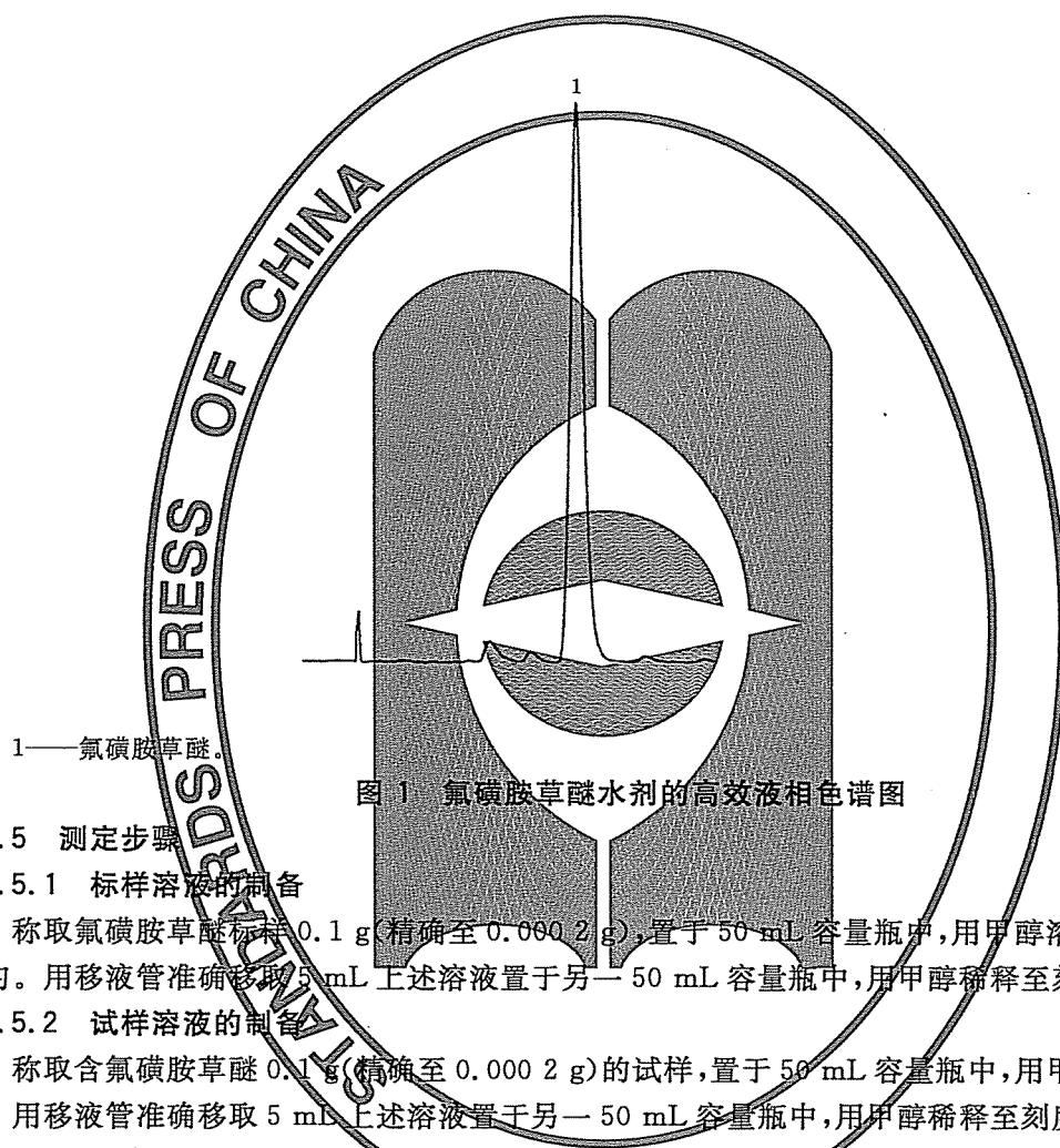
图 1 氟磺胺草醚水剂的高效液相色谱图

上述操作参数是典型的,可根据不同仪器特点,对给定的操作参数作适当调整,以期获得最佳效果。 典型的氟磺胺草醚水剂高效液相色谱图见图 1。